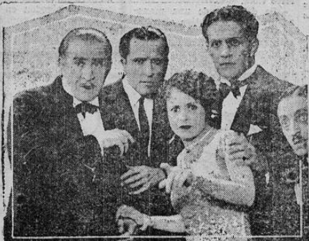
A Scene from "JADE JADE BOX" A UNIVERSAL CHAPTER PLAY

La estupenda serie "El Estuche de Jade" ha logrado un gran éxito. Hoy continúa su exhibición en el "Moderno"